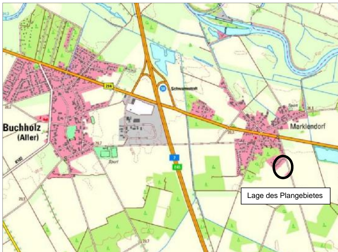
Abbildung 2: Lage des Plangebietes (Verden Navigator 2016)

Der Geltungsbereich umfasst Teile der Flurstücke 12/10 und 12/13, Flur 5, in der Gemarkung Marklendorf. Die genaue Geltungsbereichsabgrenzung ist der Planzeichnung zu entnehmen.