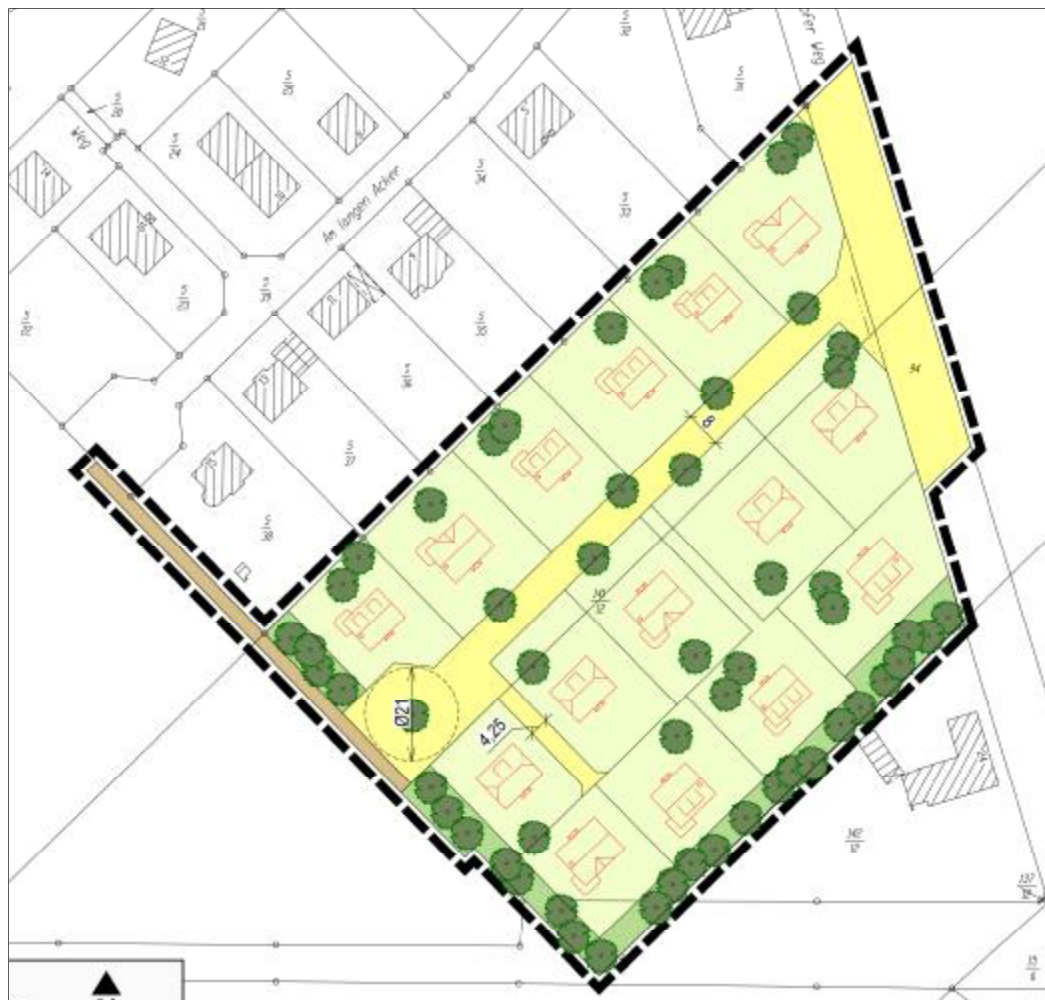
Abbildung 3: Städtebaulicher Entwurf zur geplanten Erschließungssituation (H&P Ingenieure GbR, 2017)

Der Wendehammer im südwestlichen Bereich ermöglicht das problemlose Durchfahren für Entsorgungsfahrzeuge sowie auch für Rettungsfahrzeuge. Die genaue Gestaltung bleibt der Ausbauplanung vorbehalten.